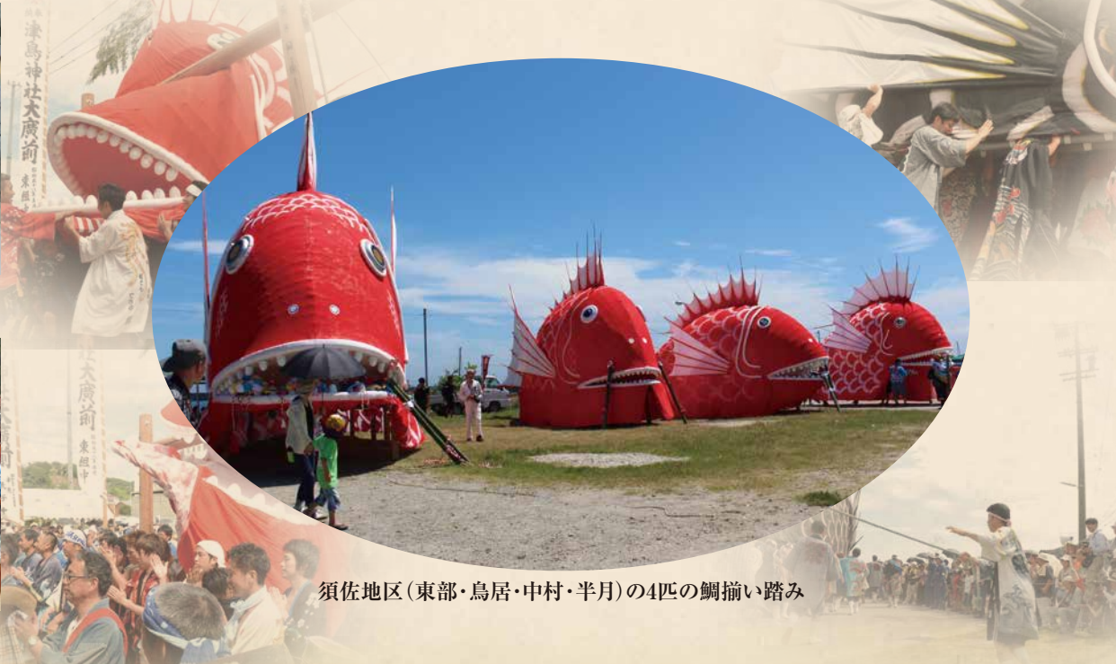
須佐地区(東部・鳥居・中村・半月)の5匹の鯛揃い踏み