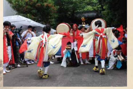
須佐地区太鼓打ち

発行：豊浜まちづくり会 協力：豊浜区民会、豊浜商工会、豊浜観光協会、豊浜漁業協会、豊浜漁業協同組合、あいち知多農協南知多事業部