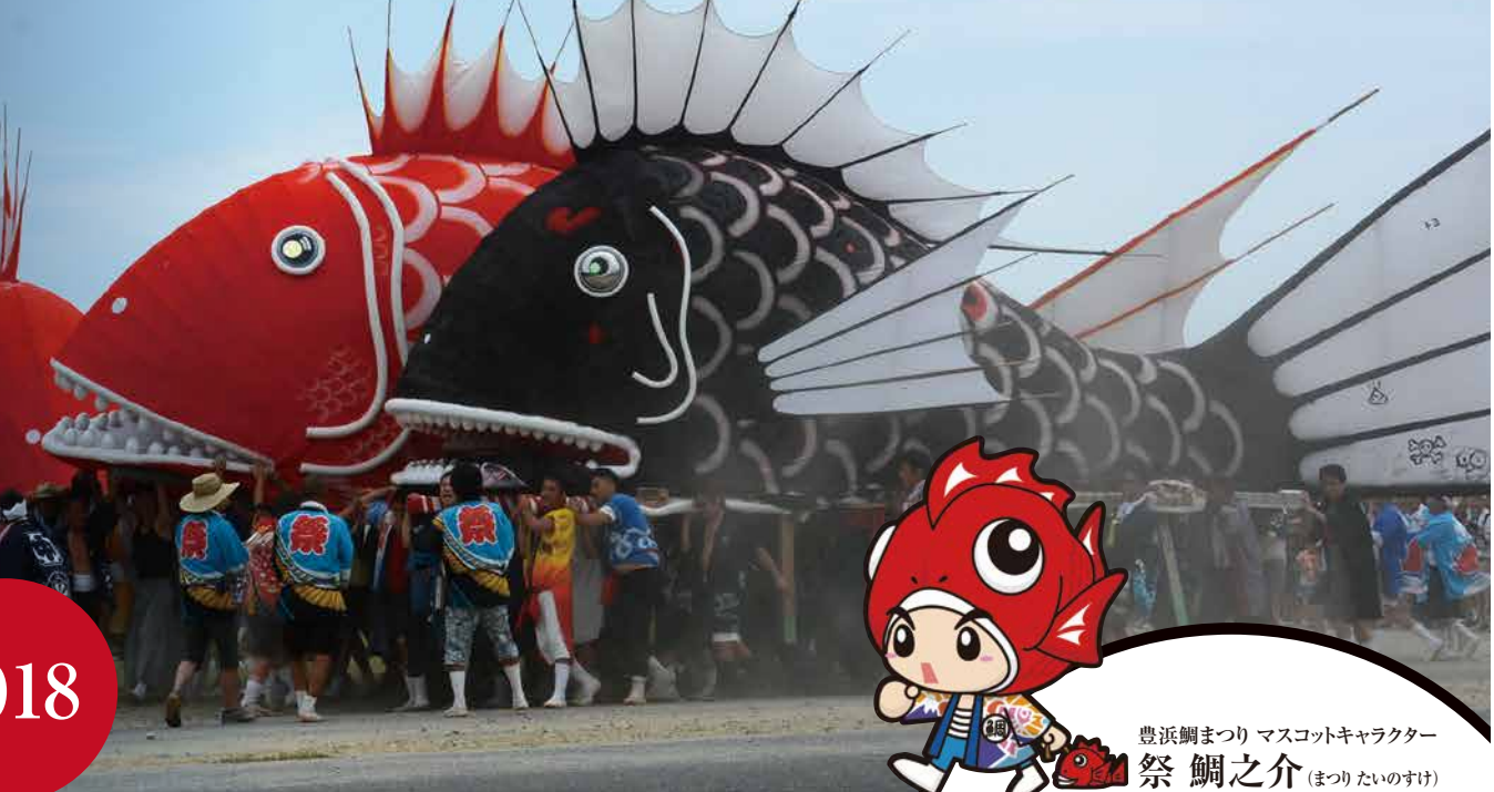
豊浜鯛まつり マスコットキャラクター 祭鯛之介(まつりたいのすけ)