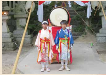
中洲地区太鼓打ち