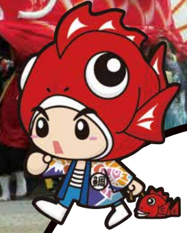
豊浜鯛まつり マスコットキャラクター 祭鯛之介 (まつりたいのすけ)

愛知豊浜「天下の奇祭」鯛まつり 開催日 / 平成29年 7月22日(土)・23日(日) 2017 ※中洲地区「大鯛」は7月23日(日)のみ